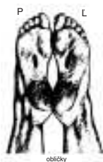
Reflexné miesto obličiek (pravé a ľavé chodidlo)